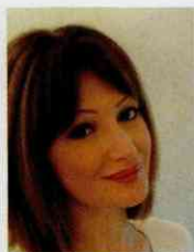
Par Stéphanie ROELS , coach de managers et dirigeants, formatrice et experte en affirmation de soi et leadership pour Orsys.